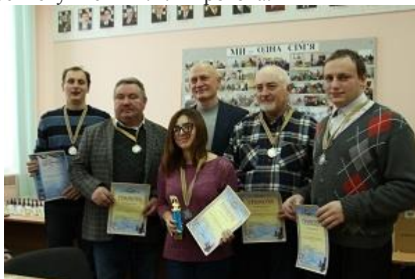
2-е місце – команда Івано-Франківського медичного університету