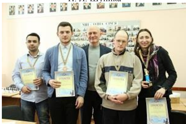
3-є місце команда Вінницького національного медичного університету імені М. І. Пирогова