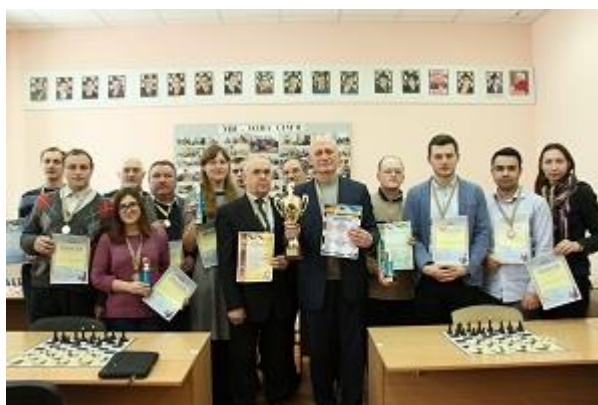
Чемпіони і призери змагань