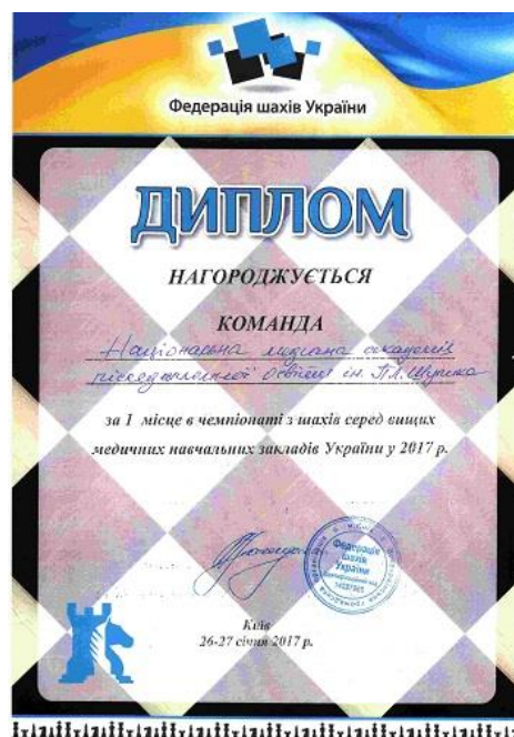
Чемпіонат із шахів серед ВНМЗУ(Київ, 26-27 січня 2017року