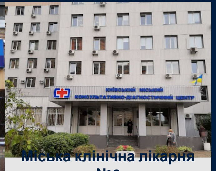
Міська клінічна лікарня №8